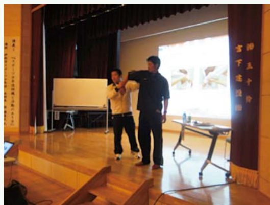
肘や肩についてのケガの確認方法を実演中です