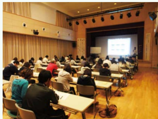
プロジェクタを使って進めていきました